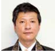
ゆき いっせい 幸 一誠